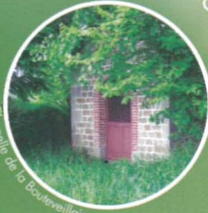
Chapelle de la Bouteveillais

L'Église de Landéan est sous l'invocation de Saint-Pierre. Elle porte la trace des différents styles allant du roman au gothique flamboyant.