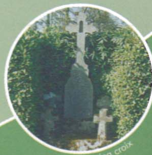
Les cinq croix