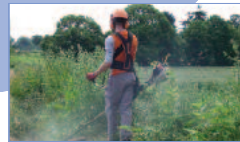
4 - Suivi / entretien pendant 3 ans.