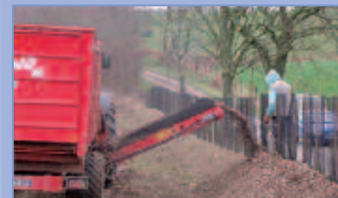
2 - Paillage biodégradable (ici : copeaux)