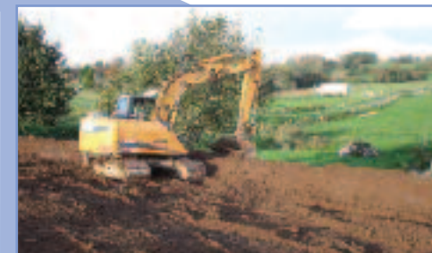
1 - Création de talus