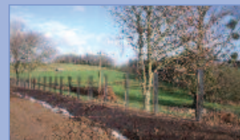
3 - Plantations