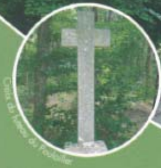
Croix du village de Fougères