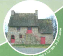
Chaumière Landes de Jaunouse