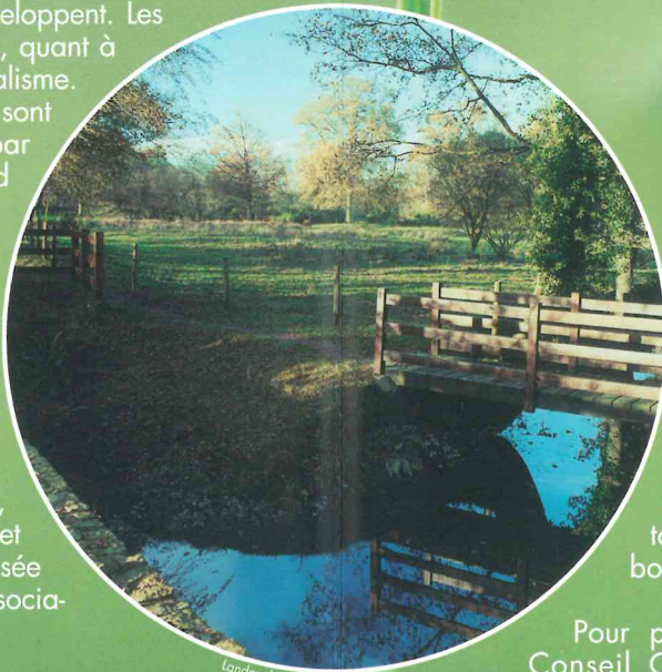
Landes de Jaunouse