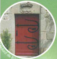
Portail de Billé