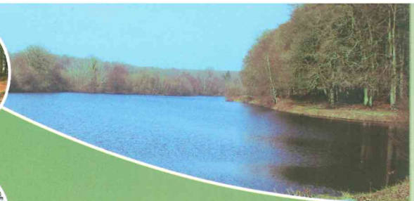
Etang de St François