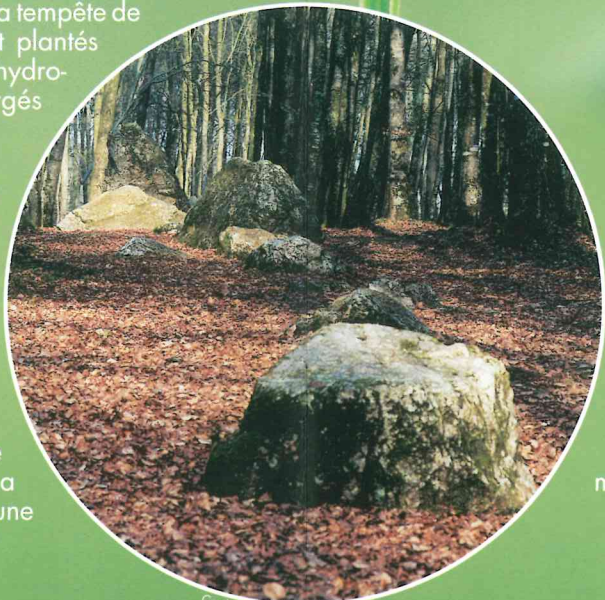
Cordon des Druides

A propos du marquage des arbres, le saviez-vous ? Les numéros sur les arbres indiquent le numéro de parcelles. L'ONF exploite la forêt parcelle par parcelle. Il y en a 134 en forêt de Fougères d'environ une douzaine d'hectares chacune.