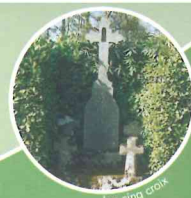
Les cinq croix

L'Église de Landéan est sous l'invocation de Saint-Pierre. Elle porte la trace des différents styles allant du roman au gothique flamboyant.