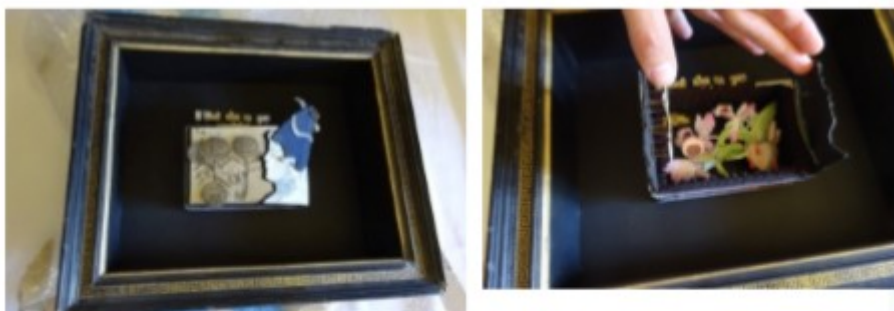
La version miniature, en volume, est dans la collection de la Galerie Albert - Bourgeois

Le petit format original en volume a été acquis par la Galerie et fait partie de sa collection. La version murale est toujours visible par les soignants, les patients et leurs familles au centre hospitalier de Fougères.