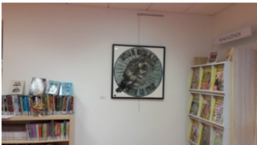
Inutile de monter au ciel pour côtoyer les étoiles, 2018, digigraphie -

collection de la galerie d'art Albert-Bourgeois/ Fougères agglomération