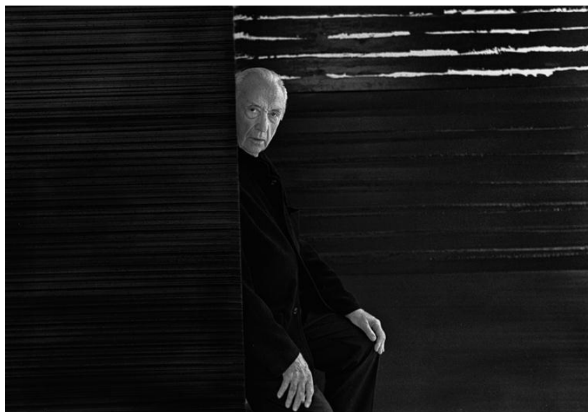
Pierre Soulages, photographie Raphaël Gaillarde - 2 octobre 2017

L'oeuvre d'Olivier Masmonteil regorde de références à l'histoire de l'art. La lithographie présente dans la collection de la Galerie permet de revenir sur le parcours atypique de Pierre Soulages dans la peinture française.