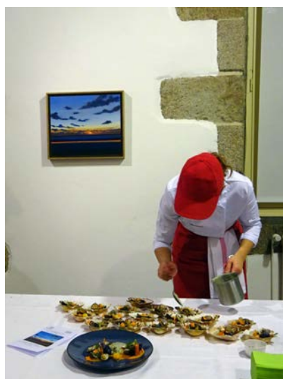
Etudiante du lycée hôtelier de Dinard en préparation de l'entrée devant l'oeuvre d'Olivier Masmonteil qui lui a inspiré cette recette.

Les couleurs et le thème du tableau ont donné l'idée de la recette Coquillages et légumes d'Automne , un régal pour les yeux et pour les papilles !