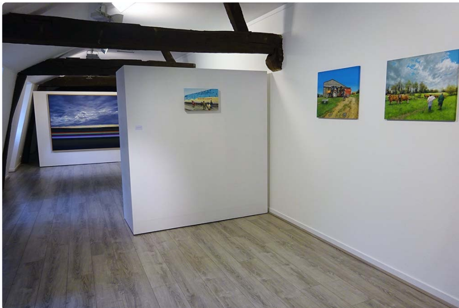
Vue de l'exposition "Penser le paysage" - 1er plan : Julien Beneyton / 2nd plan : Olivier Masmonteil

Olivier Masmonteil présente les peintures réalisées suite à son tour du monde. Originaire de Corrèze où les paysages l'ont beaucoup inspiré, Olivier Masmonteil a réalisé voilà une dizaine d'années un tourvoyage autour du monde pour se constituer comme une collection photographique de paysages qui lui ont servi de prétexte à réaliser tout un ensemble de petites et grandes peintures. On y retrouve toutes les composantes attendues d'un paysage figuratif avec le ciel, la mer, la montagne, la plaine, le soleil levant ou couchant. Les tableaux ici présentés offrent à voir un jeu de lignes abstraites, tirées au cordeau, qui font écho à la ligne d'horizon dans un dispositif chromatique qui interroge le regard.