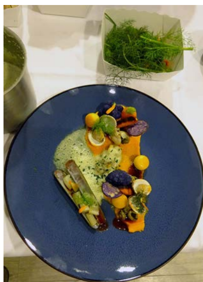
Coquillages et légumes d'Automne