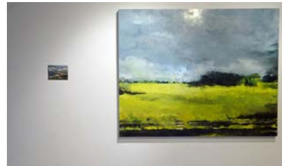
Régis Perray, 30ème Ponsée la mer, huile sur bois, 16 x 22cm Philippe Cognée, Paysage, 2012, peinture à l'encaustique sur toile marouflée sur bois, 140 x 175cm

La première salle de cette exposition présente une oeuvre par artiste, une façon de présenter une variété de représentations de(s) paysage(s), de techniques (dessin, peinture à l'huile/à l'acrylique/à la cire etc.) et de styles (abstrait, figuratif).