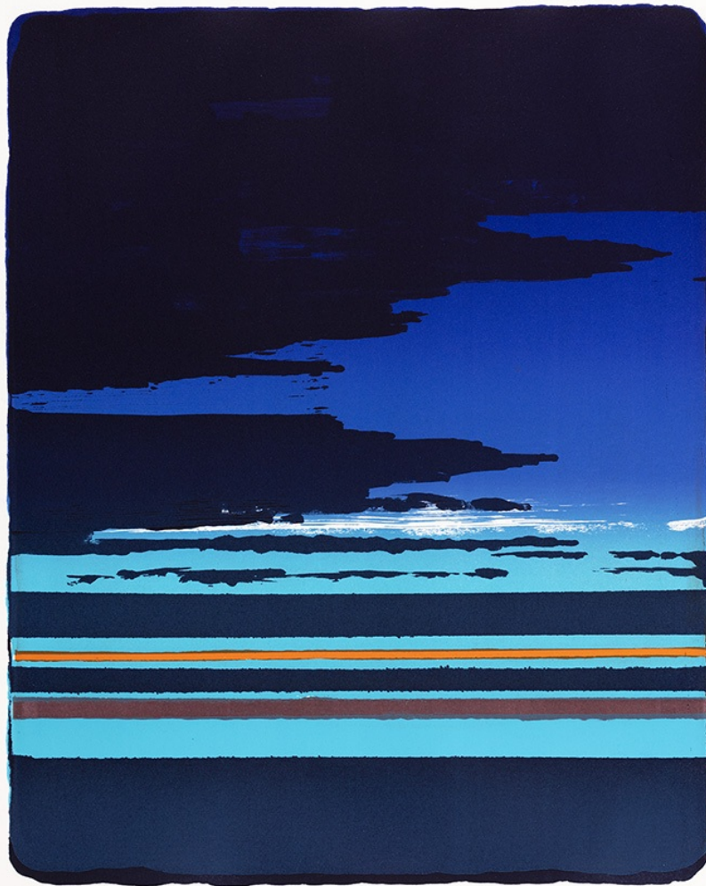
Hommage à Pierre Soulages, Olivier Masmonteil, 2019, lithographie

Suite à cette exposition, la Galerie a fait l'acquisition d'une lithographie "Hommage à Pierre Soulages" dans laquelle on retrouve le mélange figuration/abstraction propre à Olivier Masmonteil.