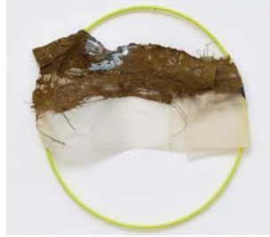
Philippe Pignet, 30ème Ponsée la mer, huile sur bois, 16 x 22cm