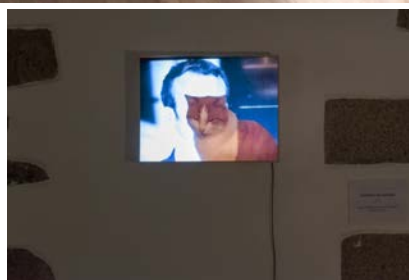
Vue de l'exposition "Double Face", de Chantal Lorient-Mélia - Salle 2