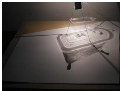
L'ami du peuple , série Les emballages perdus , Lorient & Mélia - 2005