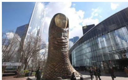
Le pouce , César - 1965