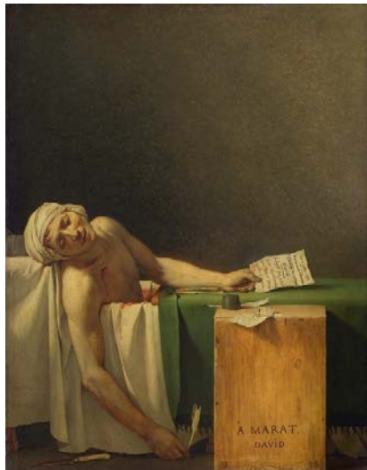
La mort de Marat , Jacques-Louis David - 1793

Jacques-Louis David fait de la mort de Marat le symbole du martyr révolutionnaire. Il choisit une composition simple et dépouillée où ne figure que le corps de Marat en train d'expirer. L'artiste connaissait Marat, et lui avait rendu visite la veille de sa mort, le trouvant dans son bain dans des draps pour prévenir de problèmes de peau qui le faisaient souffrir. David choisit de rendre hommage à son ami en le représentant tel qu'il l'avait vu lors de sa dernière visite. Une vision fidèle, à ceci près que ce visage, parfaitement apaisé et harmonieux, souriant même, ne montre pas clairement les défauts de la maladie de Marat : il témoigne surtout de la tendresse que porte Jacques-Louis David au mort, et de sa volonté d'en faire un nouveau Christ.