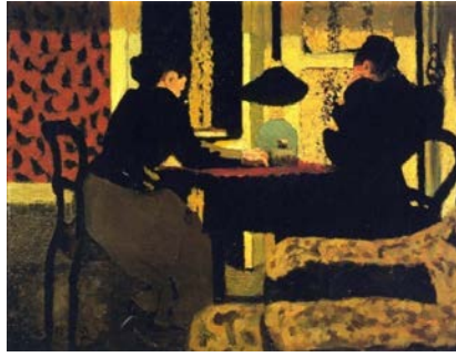
Deux femmes sous la lampe , Edouard Vuillard - 1892