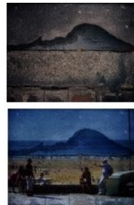
Embrouillement pour Cythère , Lorient & Mélia - 2010

tirage photographique sur caisson lumineux éteint, puis allumé