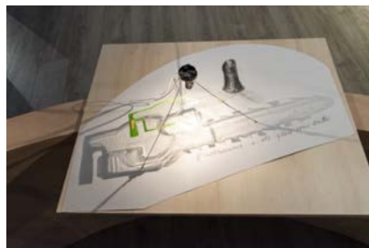
L'instrument a été placé sous scellé , de la série Les emballages perdus - 2005

Le Pouce est une série d'oeuvres du sculpteur César entreprise à partir de 1965. Il s'agit de l'empreinte de son propre pouce par moulage, qu'il agrandit ensuite à 40 cm et réalise en plastique translucide rose. La sculpture reproduit fidèlement le doigt tendu de l'auteur (ongle, plis de la peau, dermatoglyphes, etc.) qui, reposant sur la zone qui le relie d'ordinaire au reste de la main, semble ainsi dressé vers le haut. Le plus grand agrandissement, un bronze exposé à La Défense, mesure 12 m de haut et pèse 18 t.