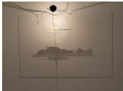
L'île des morts , Lorient & Mélia - 2005

Il s'agit d'une série de cinq tableaux peints entre 1880 et 1886 par Arnold Böcklin.