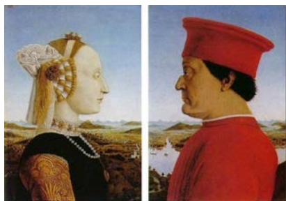
Le Triomphe de la chasteté ou Double Portrait des ducs d'Urbino , Piero della Francesca - vers 1465