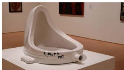
Fontaine , Marcel Duchamp - 1917