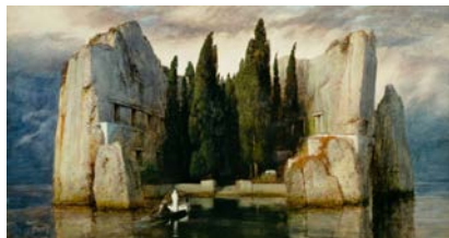
L'île des morts , entre 1880 et 1886