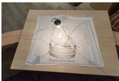
Tempête dans un bocal , série Les emballages perdus , Lorient & Mélià - 2005

Fontaine est un ready-made, terme prononcé pour la première fois par Marcel Duchamp en 1916. Il s'agit d'un objet manufacturé qu'un artiste s'approprie tel quel, en le privant de sa fonction utilitaire. Il lui ajoute un titre, une date, éventuellement une inscription et opère sur lui une manipulation en général sommaire, avant de le présenter dans un lieu culturel où le statut d'oeuvre d'art lui est alors conféré.