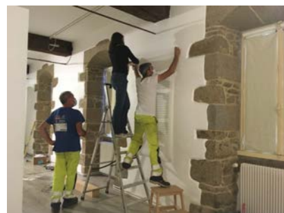
Montage de l'exposition "Double Face"

Une fourmillère s'est affairée pendant un peu plus d'une semaine pour transformer la Galerie et présenter une exposition pleine de poésie : réfléchir à la scénographie de l'exposition, préparer les supports accueillant les oeuvres,