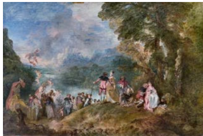
Embarquement pour Cythère , Watteau - 1717