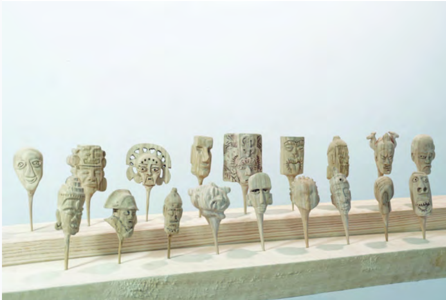
Coline Charcosset, CANINES (en cours), 2019 , bois de châtaigner, chacun 11x6x3cm environ.

Né en 1988 à Sheffield (Angleterre), Rémi Mort vit et travaille à Rennes. Plasticien, sculpteur, performeur et auteur de théâtre, cet artiste est diplômé de l'Ecole Européenne Supérieure des Arts de Bretagne depuis 2013.