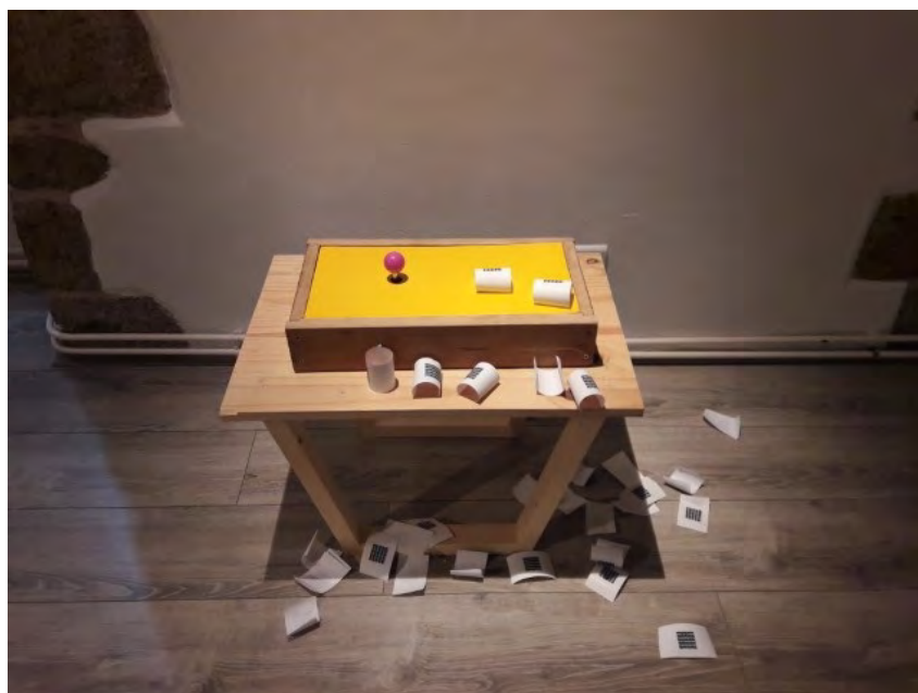
Print my joystick, 2021-Installation multimedia