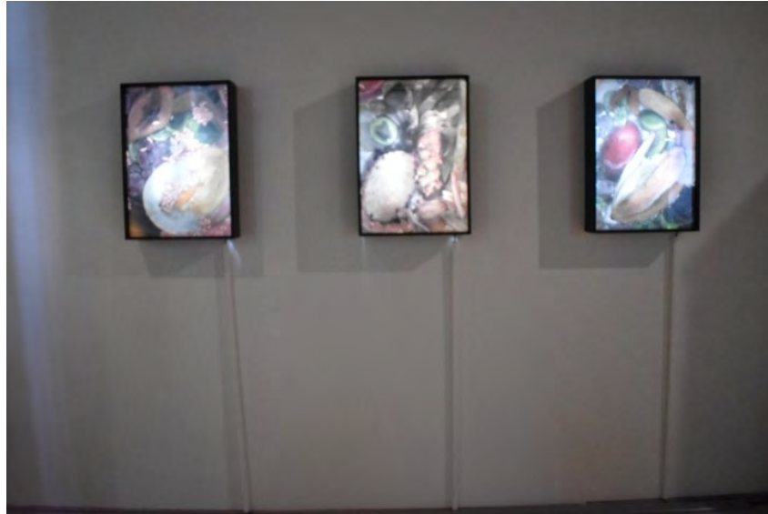
SALADE FRUITS, 2016, impressions sur papier, caissons lumineux, 46 x 64 cm.

Dans l'exposition à la Galerie, Coline Charcosset présente une série d'images intitulée "Salade de fruits".