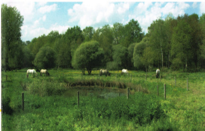
Chevaux mulassiers du Poitou.

De plus, chaque année le Conseil général organise des animations pédagogiques sur le site pour sensibiliser les collégiens d'Ille-et-Vilaine à la préservation de leur environnement.