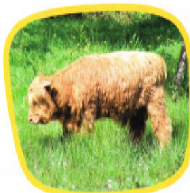
Voche Highland Cattle : une espèce rustique originaire d'Écosse. Ses larges pattes et son poids réduit lui permettent de pâturer les milieux humides sans les détériorer.

Ainsi, les landes de Jaunouse sont entretenues par deux espèces animales peu ordinaires : les vaches Highland Cattle et les chevaux mulassiers du Poitou.