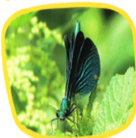
Proche de la libellule, la demoiselle (ici Calopteryx verna) est plus petite et peut replier ses ailes.

Des araignées et de nombreux insectes tels que les sauterelles peuvent être observés dans les prairies et les landes humides. On y trouve notamment le criquet ensanglanté et le conocéphale des roseaux. Les mares et ruisseaux sont le royaume des libellules et des demoiselles.