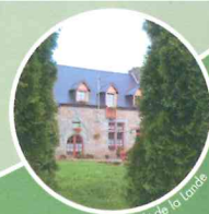
Manoir de la Lorée