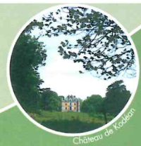
Château de Kodéan