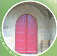
Église St Martin de Lécousse

Pour les amateurs, le début du circuit vous permet un petit détour pour visiter le Château de Fougères mais aussi la première église de Fougères, l'église Saint Sulpice (XV ème – XVIII ème ).