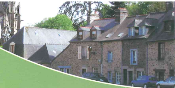
Quartier St Sulpice, Fougères