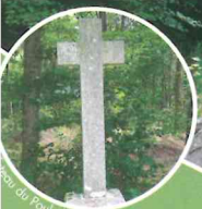
Croix de Foubail