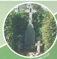
Les cinq croix

L'Église de Landéan est sous l'invocation de Saint-Pierre. Elle porte la trace des différents styles allant du roman au gothique flamboyant.