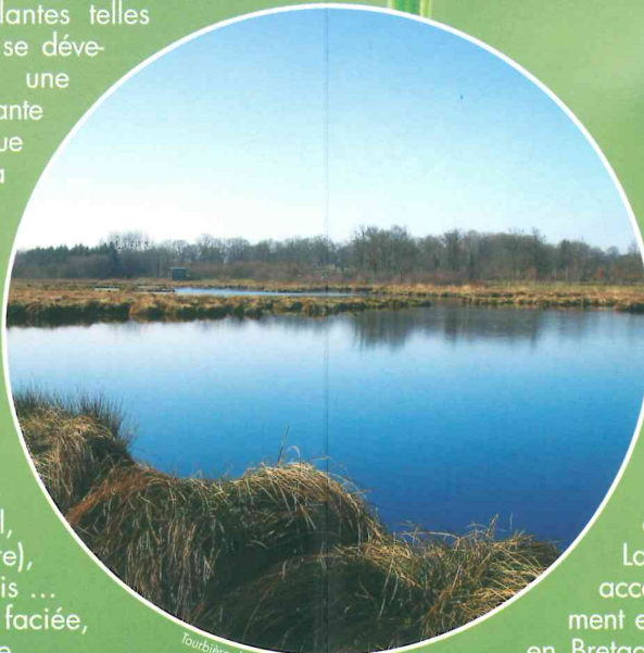
Tourbière de Lande Marais