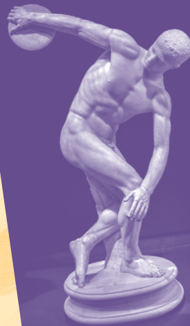
Myron, Discobole , 450 av J.-C., 156 cm

Il est difficile de convaincre du caractère indispensable de l'art mais on peut admettre assez facilement que sans art une société étouffe; il en est la nécessaire respiration.